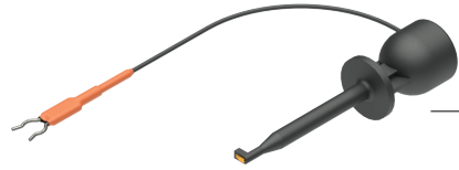
890-400-021 HT- Masseleitung 10 cm auf 4 mm Bananenstecker