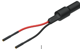
890-400-022 HT-Masseleitung 10 cm